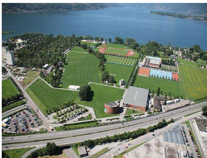
Tenero CST: Ansicht der Sportanlagen von oben.