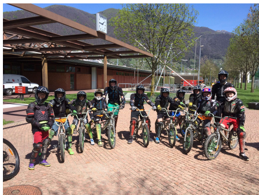
BMX: Gruppenbild nach BMX-Training